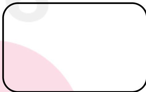
Carimbo do Diretor